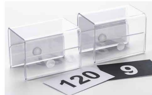
Reihenummerierung Klemme groß